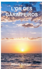
L'or des Garimpeiros